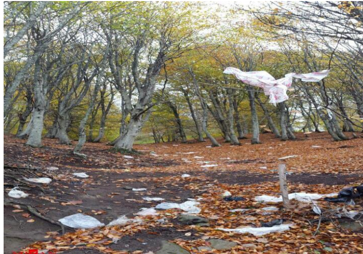
شکل ۳: جاده اسالم به خلخال ۳

پلاستیک‌های بی‌خزان، خزان اسالم به خلخال را تحت تأثیر قرار داده‌اند. باد که می‌وزد، به‌جای ریزش برگ صدای خش‌خش پلاستیک‌های لابه‌لای شاخه‌های درختان می‌آید. اطراف جاده پر از محله‌های انباشت زباله است. درختانی که پلاستیک جای برگ بر آنها رویده است، بی‌شمارند و نهادی برای رسیدگی به آنها وجود ندارد.