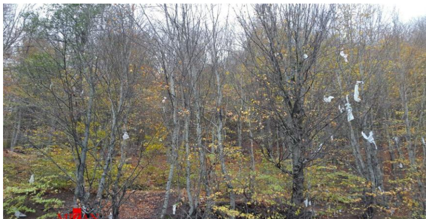
شکل ۱: جاده اسالم به خلخال ۱

جاده اسالم به خلخال، یکی از دیدنی‌ترین جاده‌های ایران است. جاده‌ای که در هر فصل رنگ‌وبوی خاصی دارد و گردشگران برای تماشای زیبایی‌هایش به آن سفر می‌کنند. بهارهایش بی‌نظیر است، شکوه عوض‌شدن فصل را می‌توان در منظره‌های بکر اسالم و خلخال دید. تابستانش مملو از گردشگر است و بسیاری می‌آیند تا شب‌های خنک این جاده را تجربه کنند و سفیدی برف که بر قله‌های آن می‌نشیند. جاده اسالم به خلخال اگر باز باشد، بسیار شگفت‌انگیز است.